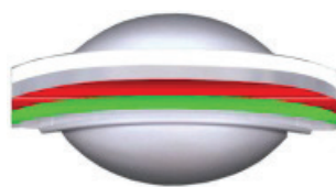
Breite x Höhe: 175 x 73 mm