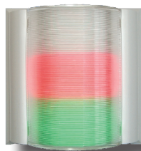
Breite x Höhe: 80 x 80 mm