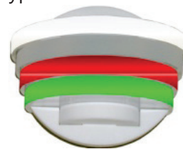
Breite x Höhe: 100 x 80 mm