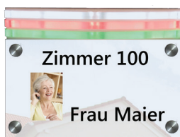
Breite x Höhe: 210 x 184,5 mm