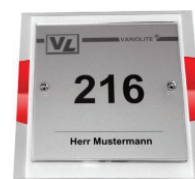
Breite x Höhe: 180 x 180 mm