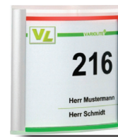
Breite x Höhe: 148 x 120 mm