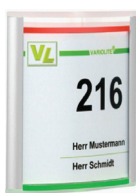
Breite x Höhe: 148 x 150 mm