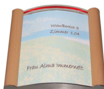
Breite x Höhe: 180 x 180 mm